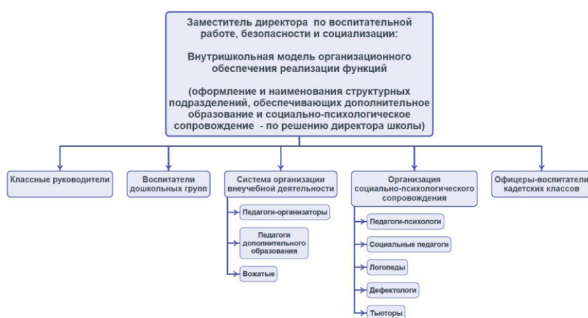
Схема 2. Кадровое обеспечение реализации программы воспитания

В педагогическом плане среди базовых национальных ценностей необходимо установить одну важнейшую, системообразующую, дающую жизнь в душе детей всем другим ценностям — ценность Учителя.